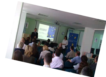
ERSTE Bank Group - javno

Edukativne aktivnosti za klijente na temu europskih politika i fondova – previđeno 8 lokacija, do sada održane 4 akademije. Predstoje Rijeka (22.5.), Pula (23.5.), Zadar (6.6.) i Split (7.6.).